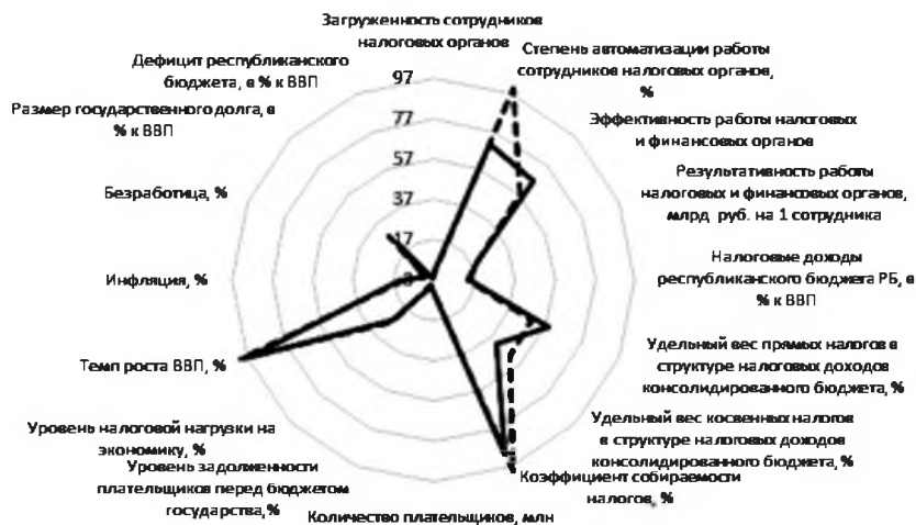
Рис. 2. Система Balanced Scorecard для налоговой политики Республики Беларусь в 2015 г.

вых и фактических показателей системы BSC для налоговой политики Республики Беларусь практически полностью совпадают для блоков «Финансы/Экономика» и «Процессы», и имеют существенные отличия для блоков «Инфраструктура/Сотрудники» и «Плательщики». Это означает, что либо для показателей данных блоков устанавливаются необоснованно высокие (низкие) плановые значения, либо неэффективно используются имеющиеся ресурсы (высокая загруженность персонала при достаточно низком уровне автоматизации его работы).