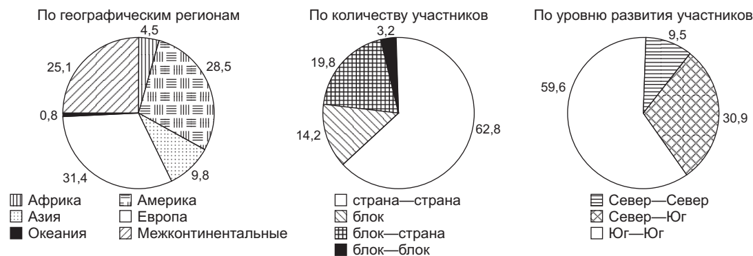
Рис. 1. Структура соглашений, регулирующих социально-экономические права, %