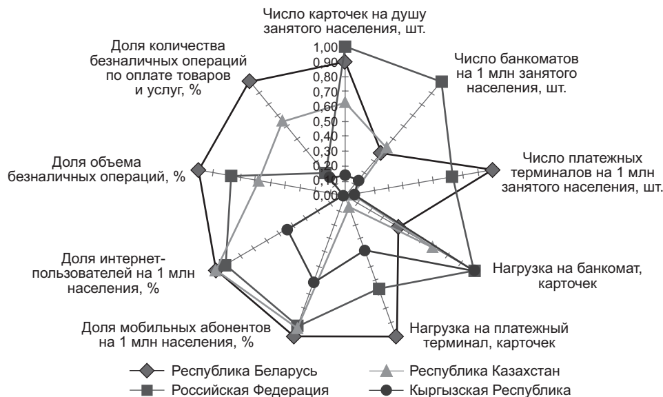
Рис. 3. Многоугольники конкурентоспособности РБПК стран — участниц Таможенного союза