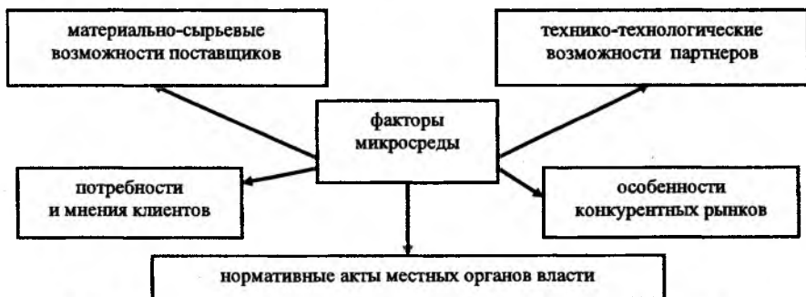
Рис. 1. Факторы, обеспечивающие создание благоприятных условий для осуществления инновационной деятельности на предприятии

Важнейшие факторы микросреды инновационной деятельности предприятия изображены на рисунке 1: