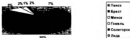
Рис. 1. Процентное соотношение отгрузок по регионам

Продукция комбината реализуется не только в пределах Республики Беларусь (рис. 1), но и отправляется на экспорт.