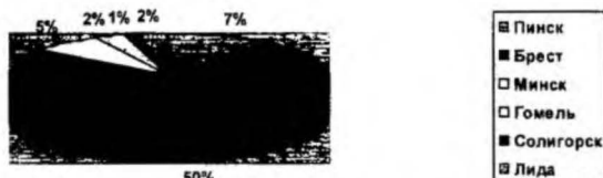
Рис. 1. Процентное соотношение отгрузок по регионам

Продукция комбината реализуется не только в пределах Республики Беларусь (рис. 1), но и отправляется на экспорт.