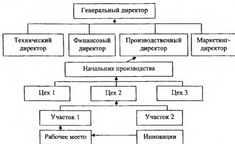
Рис. 1. Линейно-функциональная структура управления предприятием

На сегодняшний день реальных окупаемых бизнес-проектов намного меньше, чем кредитных ресурсов для их финансирования, тогда как в развитых странах ситуация прямо противоположная. На наш взгляд, одной из основных причин такого состояния является несовершенство организационных структур отечественных предприятий, которые имеют линейно-функциональную структуру управления, не позволяющую вписываться в мировое разделение труда (рис. 1) вследствие несовпадения центра внедрения инноваций (рабочих мест) с центром распределения ресурсов (директор).