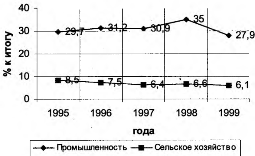
График 2. Динамика инвестирования в основной капитал отраслей экономики за 1995–1999 гг.