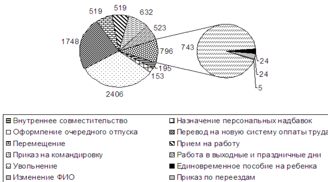
Рисунок 3 – Статистика оформления распорядительных документов в Управлении кадров Югорского государственного университета за 2008 год Примечание – Источник: собственная разработка на основе [4]

Программный модуль «Управление персоналом» производства корпорации «Галактика», внедренный в Югорском Государственном Университете, отличается удобством в использовании. Он позволяет значительно упростить документооборот, что в условиях высшего учебного заведения является большой проблемой. Количество документов, оформленных с помощью данного модуля в управлении кадров Югорского государственного университета за 2008 год, представлено на рисунке 3.