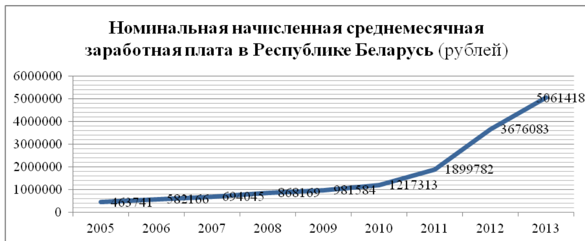
Рисунок 1 – Динамика номинальной начисленной среднемесячной заработной платы в Республике Беларусь в 2005-2013 годах

Динамика номинальной начисленной среднемесячной заработной платы за 2005-2013 гг. представлена на рисунке 1.