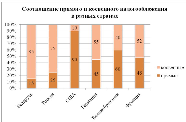
Рисунок 4 – Процентное соотношение прямых и косвенных налогов в структуре доходов бюджетов разных стран