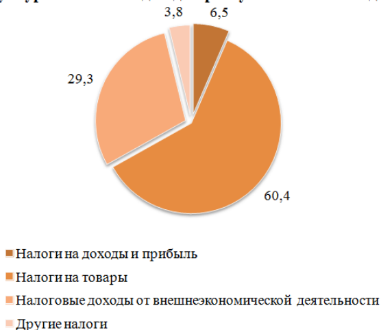
Рисунок 2- Структура налоговых доходов республиканского бюджета 2016 г.