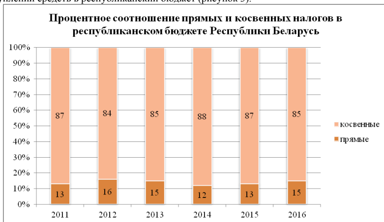
Рисунок 3 - Процентное соотношение прямого и косвенного налогообложения в Республике Беларусь

В Республике Беларусь к косвенным налогам относят налог на добавленную стоимость, акцизы, налоги от внешнеэкономической деятельности. Анализ процентного соотношения прямых и косвенных налогов в республиканском бюджете страны за последние годы показывает, что в стране преобладают косвенные налоги, что связано, прежде всего, с моделью нашей экономики, поскольку косвенные налоги обеспечивают стабильность поступлений средств в республиканский бюджет (рисунок 3).