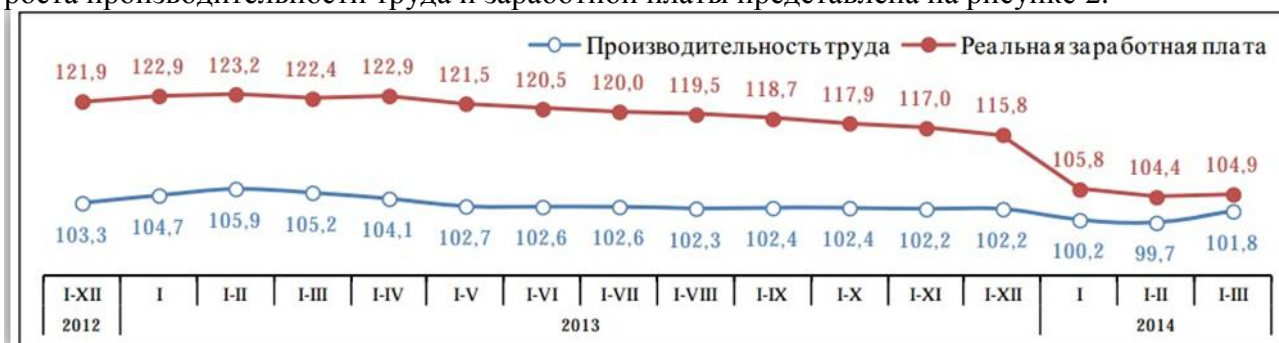
Рисунок 2 - Динамика темпов роста производительности труда и заработной платы за 2013-2014 г. в % по отношению к соответствующему периоду предыдущего года

В настоящее время при постоянном росте уровня заработной платы актуальным является вопрос о соотношении темпов роста заработной платы с темпами роста производительности труда. Уровень заработной платы, с одной стороны, зависит от достигнутого уровня производительности труда работников, с другой стороны, воздействует на уровень производительности труда. При этом чрезмерный рост заработной платы в текущем периоде приводит к сокращению объема средств, направляемых на расширение производства, совершенствование техники и технологии, что сдерживает рост производительности труда, а соответственно и заработной платы в последующих периодах. Данные обстоятельства указывают на необходимость поддержания оптимальных пропорций между темпами роста производительности труда и заработной платы. Динамика темпов роста производительности труда и заработной платы представлена на рисунке 2.