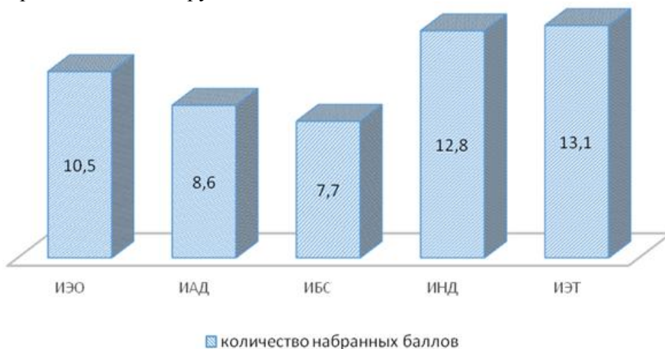
Рисунок 3 - Зароботная плата которых ниже среднего значения з/п в Республике Беларусь

В данной группе полученные результаты соответствуют результатам ниже нормы: выражен индекс экономической тревожности, опросник показал также и наличие финансового стресса, отмечается экономический пессимизм как во внешних так и внутренних условиях роста материального благополучия. Адекватность дохода запросам и потребностям личности входит в рамки нормы. Материальное положение семей данной группы, показывает результат ниже нормы, что говорит о низком уровне текущего благосостояния семей. Также результаты показали выраженную степень недостатка финансовых средств в данной групп