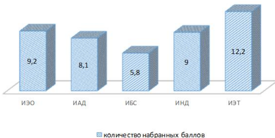
Рисунок 2 - Зароботная плата которых приближена к средней з/п в Республике Беларусь

Индекс субъективной адекватности дохода запросам и потребностям, свидетельствует о норме соотношений данных понятий (доходы и потребности) в данной группе. Изучение индекса текущего благосостояния семьи, в данной группе показал средний уровень материального положения семье.