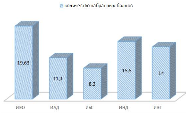
Рисунок 1- Зарботная плата которых выше среднего уровня заработной платы в Республике Беларусь

Примечание – Источник: собственная разработка