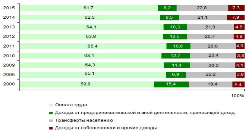
Рисунок 1 – Структура денежных доходов населения РБ Примечание – Источник: [3]

Из данного рисунка следует, что более 60% денежных доходов населения Беларуси составляет оплата труда. Стоит заметить, что в период с 2013 по 2015 годы удельный вес оплаты труда уменьшился в среднем на 1,2 процентных пункта, если сравнить 2015 год с 2000 годом, то можно заметить, что оплата труда увеличилась на 3,2 процентных пункта. Удельный вес доходов от предпринимательской деятельности в структуре доходов населения на протяжении 15 лет уменьшался. В 2000 году они составляли 15,4%, что на 7,2 процентных пункта больше, чем в 2015 году (8,2%). Уменьшение удельного веса данного вида доходов свидетельствует о том, что развитие собственного бизнеса становится менее привлекательным в связи со сложным экономическим положением нашей страны.