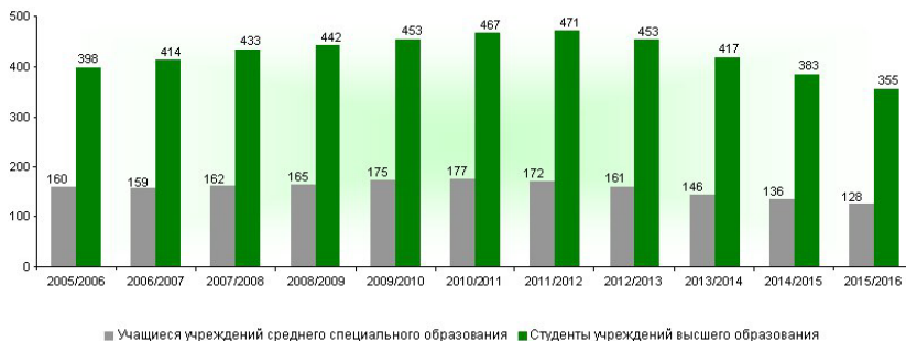
Рисунок 3 - Численность обучающихся в учреждениях среднего специального и высшего образования на 10 000 человек населения (на начало учебного года; человек) Примечание – Источник: [3]

В 52 высших учебных заведениях республики на начало 2015/2016 учебного года обучалось 336,4 тыс. студентов. В расчете на 10 тыс. человек населения численность студентов составляет 355 человек. В текущем учебном году высшее образование получают 14,6 тыс. иностранных граждан (4% всех студентов).