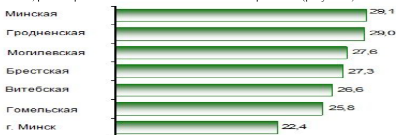
Рисунок 4 - Обеспеченность населения жильем (на конец 2015 года; квадратных метров общей площади на одного жителя) Примечание – Источник: [3].

Последним из основных показателей, характеризующих качество и уровень жизни населения, рассмотрим обеспечение населения жильем по регионам (рисунок 4).