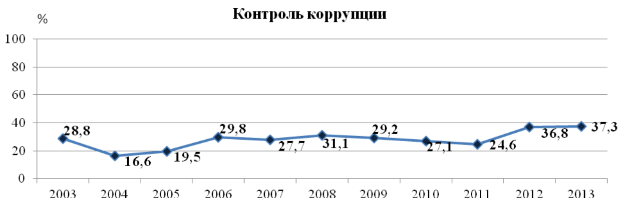
Рисунок 2 – Интегрированный показатель контроля коррупции Республики Беларусь в 2003 -2013 гг.

6) по индексу «контроль коррупции» – значение выше, чем, например, в Российской Федерации, но ниже чем в развитых странах, что свидетельствует о необходимости ужесточения контроля коррупции в стране. Динамика данного показателя в Республике Беларусь представлена на рисунке 2.