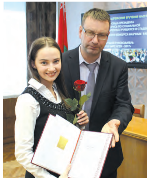
университете. Для меня наука – хорошая гимнастика для ума и способ самореализации.

— С большой теплотой вспоминаю каждого преподавателя, — говорит девушка, — который встретился на моем пути за годы учебы в