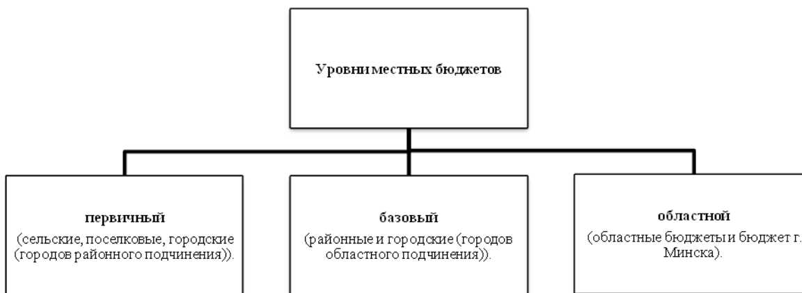
Рисунок 1 – Уровни местных бюджетов Республики Беларусь

В Республике Беларусь согласно Бюджетному кодексу Республики Беларусь, принятому 16 июля 2008 г. № 412-З, бюджет представляет собой план формирования и использования денежных средств для обеспечения реализации задач и функций государства. Местный бюджет — это форма образования и расходования денежных средств в расчете на финансовый год, предназначенных для финансового обеспечения задач и функций местного самоуправления. Каждое региональное (муниципальное) образование имеет своей собственный местный бюджет. Местные бюджеты утверждаются решениями местных Советов депутатов, являются самостоятельной частью бюджетной системы Республики Беларусь и подразделяются на три уровня (рисунок 1) [1].