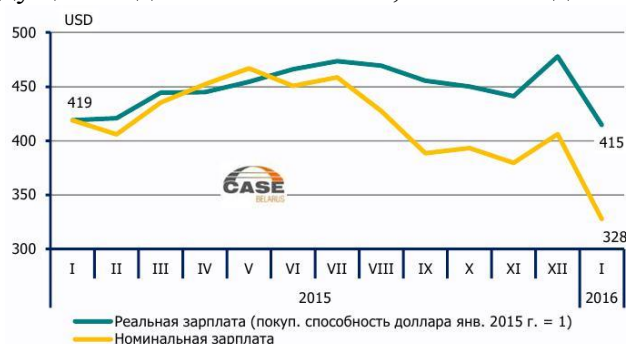
Рисунок 1 – Среднемесячная зарплата в долларовом выражении (по сравнению с январем 2015 года)

Среднемесячная номинальная зарплата в долларовом эквиваленте в январе 2015 г. к аналогичному месяцу предыдущего года снизилась на 21,7% – с 419 до 328 долларов (рис. 1).