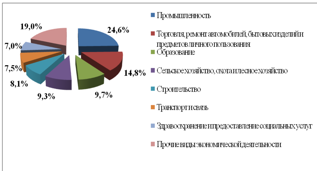
Рисунок 1 - Численность занятого населения Республики Беларусь по видам экономической деятельности на конец 2014 г. (в процентах к итогу)

На рисунке 1 представлены данные о структуре занятого населения по видам экономической деятельности на конец 2014 г.