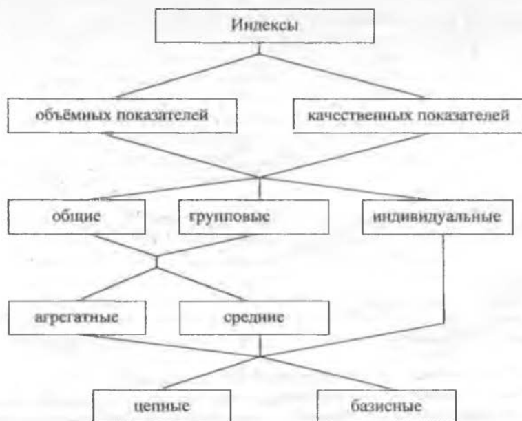
Рис. 1. Классификация индексов.

При изучении изменения качественных показателей приходится определять изменения средней величины индексируемого показателя, которое обусловлено взаимодействием двух факторов – изменением индексируемого показателя у отдельных групп единиц и изменением структуры явления. Так, средняя заработная плата на предприятии может вырасти в результате роста оплаты труда работников или увеличения доли высокооплачиваемых сотрудников. В данном случае на изменение среднего значения показателя влияют два фактора и возникает задача определения степени влияния каждого фактора на изменение средней заработной платы, а значит, и на изменение обобщающего показателя – фонда заработной платы. Анализ данного явления проводится по следующему алгоритму, представленному на рис. 2.