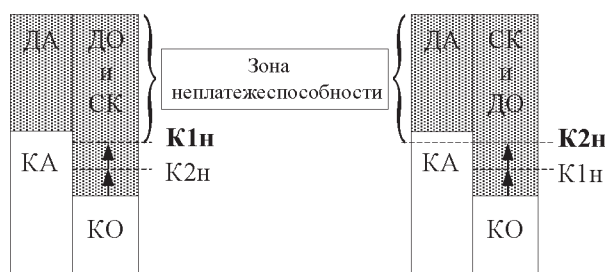
Рис. 2. Возможные соотношения нормативных значений коэффициентов K1 и K2 и особенности признания субъекта хозяйствования неплатежеспособным

Для признания организации неплатежеспособной необходимо, чтобы уровень КО превысил более высокий уровень, задаваемый нормативами K1 и K2.