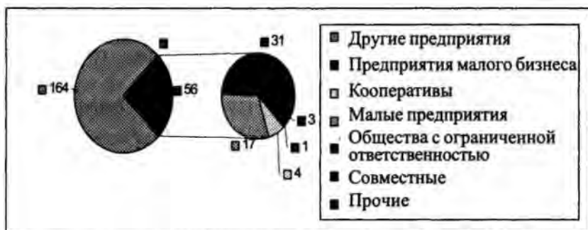
Рис. 1. Удельный вес предприятий малого бизнеса в общем количестве предприятий г. Пинска.

– многие предприятия производственного типа не смогли выплатить проценты по кредитам, взятым в качестве первоначального капитала для их открытия. Поэтому значительными темпами стало расти количество малых предприятий, специализирующихся на реализации продукции, то есть посреднических фирм, поскольку для начала их деятельности необходим значительно меньший стартовый капитал и др.