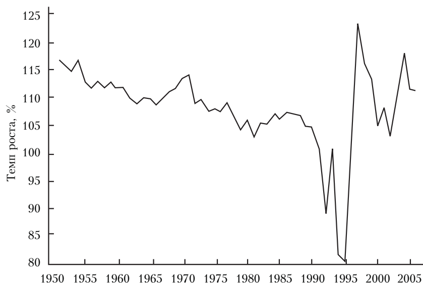
Рис. 1. Промышленный цикл Брестской области за 1950—2005 гг.

Анализируя экономическое развитие Брестской области, установлено, что более 58 % объема продукции реального сектора экономики создается в промышленности. Темпы роста валовой продукции промышленности за 1940—1990 гг. увеличились в 38 раз. В то же время индексы общего объема продукции промышленности (в процентах к предыдущему году) имеют различную тенденцию. С 1950 по 1990 гг. отмечается постепенное их снижение, что свидетельствует о застойных структурных процессах и наращивании объемов производства при сложившейся отраслевой структуре промышленности (рис. 1).