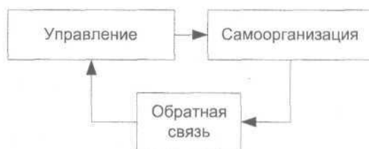
Рис. 1. Управление и самоорганизация в классической парадигме управления.

1. Классическая детерминистская парадигма. Объект управления – это система, поддержание которой в заданном состоянии – цель управления. С позиций данного подхода, «оптимальной признается ситуация, когда сложившаяся организация поддерживается ... системой управления, предметом которой становятся отклонения от фиксированных в структуре параметров порядка...» [7. С. 200]. В такой системе управление – это одностороннее воздействие; обратная связь не влияет на траекторию развития объекта управления, ее роль сводится лишь к фиксации возникших отклонений (рис. 1).