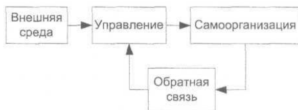
Рис. 2. Управление и самоорганизация в неклассической парадигме управления.

2. Обратной связи отводится главная роль в рамках неклассической теории управления . В ее контексте задача управления – обеспечивать постоянство внутренней среды при определенных изменениях внешней (рис. 2).