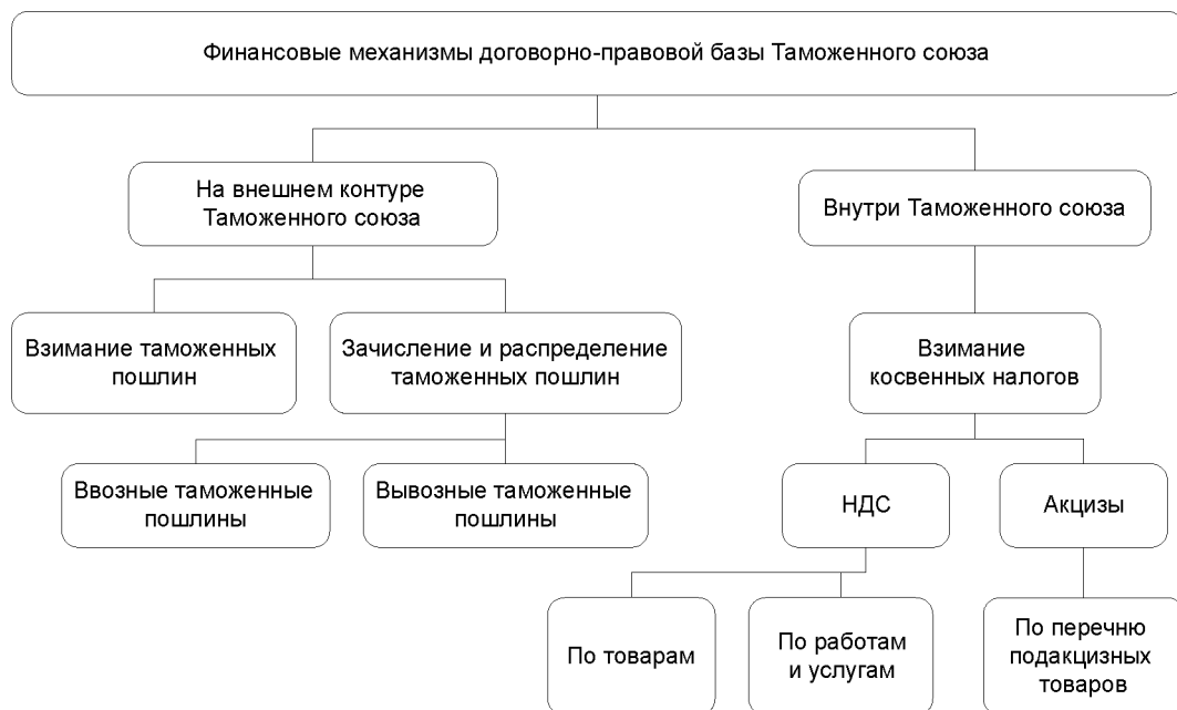
Рис. 2. Финансовые механизмы договорно-правовой базы Таможенного союза.

моженном кодексе Таможенного союза от 27.11.2009 г. с учетом изъятий, установленных Протоколом об отдельных временных изъятиях из режима функционирования единой таможенной территории Таможенного союза от 5.07.2010 г. (в отношении нефти и нефтепродуктов, а также товаров некоммерческого характера), все функции контроля перемещения товаров перенесены с внутренних границ на внешний контур. Таможенным кодексом Таможенного союза (далее Таможенный кодекс ТС) установлены: единый порядок таможенного регулирования, единые правила декларирования товаров и уплаты таможенных платежей. Товары и транспортные средства перемещаются через таможенную границу в соответствии с их таможенными процедурами, идентифицирующими статус товаров и транспортных средств при таком перемещении. Уплата таможенных платежей осуществляется в зависимости от заявленных таможенных процедур: выпуск для внутреннего потребления; экспорт; таможенный транзит; таможенный склад; переработка на таможенной территории; переработка вне таможенной территории; переработка для внутреннего потребления; временный ввоз (допуск); временный вывоз; реимпорт; реэкспорт; беспошлинная торговля; уничтожение; отказ в пользу го-