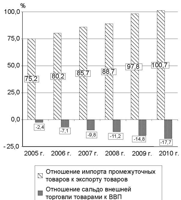
Рис. 3. Отношение импорта промежуточных товаров к экспорту товаров и отношение сальдо внешней торговли Республики Беларусь к ВВП в 2005–2010 гг.

1. Устойчивый рост отрицательного сальдо внешней торговли был обусловлен преимущественно удорожанием импорта природного газа, сырой нефти, черных металлов и других первичных сырьевых ресурсов, что предопределило формирование опережающего роста промежуточного импорта по сравнению со стоимостным объемом товарного экспорта.