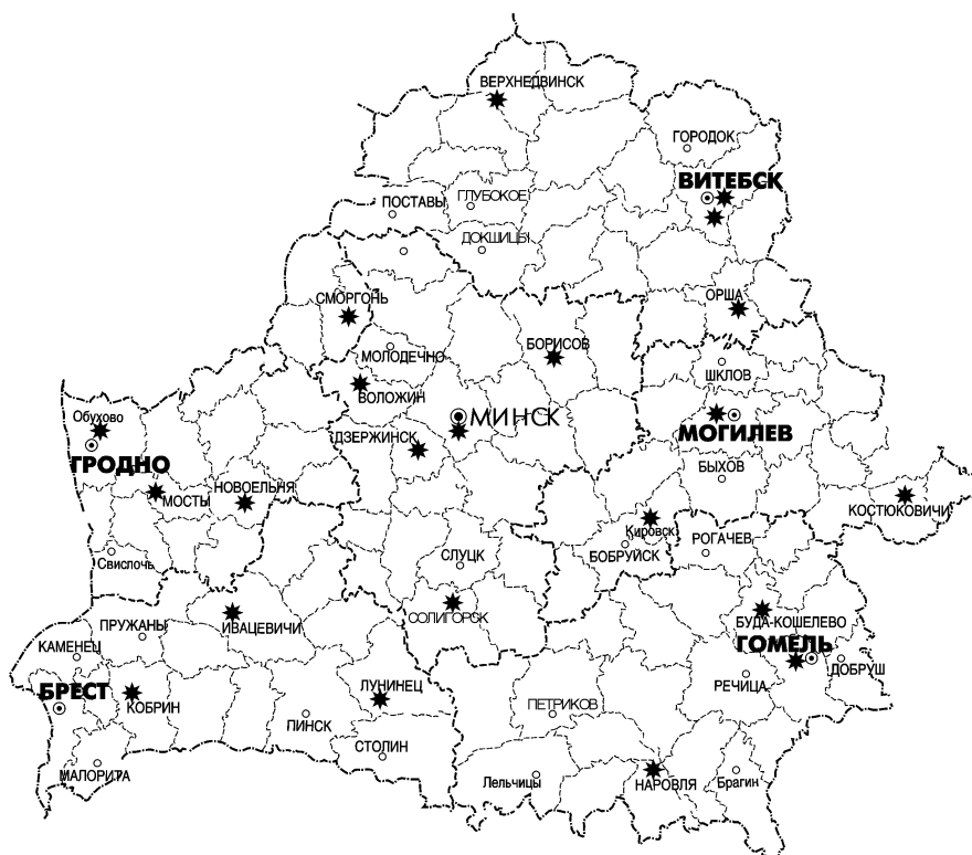
Рис. 1. Сеть действующих гарантийных ПТС техники РУП «МТЗ».