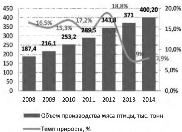
Рис. 2. Производство мяса птицы [6]

изменилось: до 2009 г. импорт мяса птицы в 1,5–2 раза превышал экспорт. Однако с 2009 г. наблюдается значительный рост объемов экспорта мяса птицы. В 2014 г. импорт составил 31,6 тыс. тонн (и вырос на 17,5 тыс. тонн), при этом экспорт оказался почти в 4 раз выше — 114 тыс. тонн (по сравнению с 2013 годом вырос на 7,4 %). Большая часть производства ориентирована на производство мяса-халяль, выполняющее требования потребителей-мусульман, что увеличивает экспортные возможности в страны Азии и Африки [3]. Среднегодовой прирост экспорта и импорта в натуральном выражении за 2008–2014 гг. составлял 35 % и 4 % соответственно.