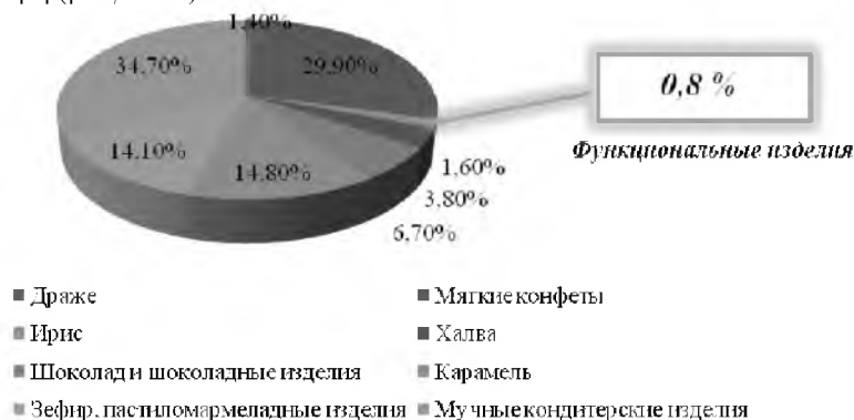
Рис. 4. Структура ассортимента кондитерских изделий белорусских предприятий

Предприятия вырабатывают широкий ассортимент кондитерских изделий [3] (рисунок 4).