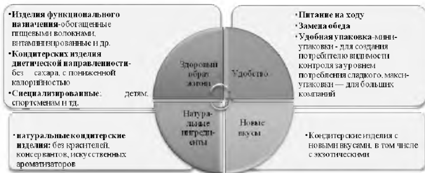
Рис. 1. Глобальные тенденции в производстве кондитерских изделий

Разработка и освоение новых видов кондитерских изделий осуществляется во всем мире по различным направлениям. Можно выделить следующие основные движущие силы развития кондитерского рынка [1, с. 57] (рисунок 1).