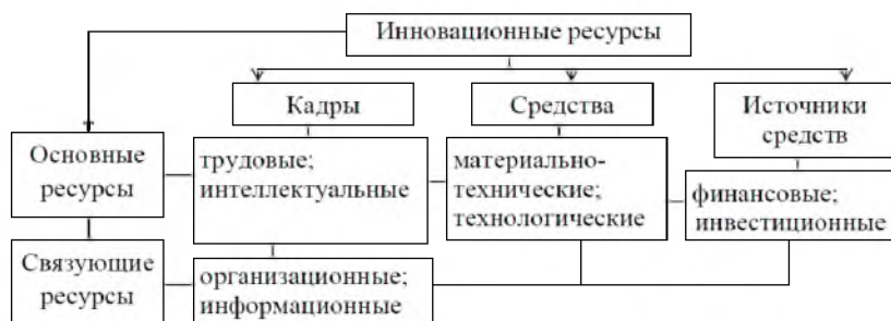
Рис. 2. Ресурсы инновационного развития предприятия

Бесспорным является факт системности инновационного развития. Как систему следует изучать совокупность ресурсов, используемых в процессе инновационного развития – инновационные ресурсы. В свою очередь в условиях инновационного развития предприятия инновационные ресурсы объединяют значительную часть ресурсов, которые можно разделить на две части: основные ресурсы (материально-технические, технологические, трудовые, интеллектуальные, инвестиционные, финансовые) и связующие ресурсы (организационные, информационные). При этом в составе основных ресурсов выделены ресурсы, характеризующие кадровую составляющую инновационного развития, средства предприятия и источники средств. Состав инновационных ресурсов приведен на рис. 2.