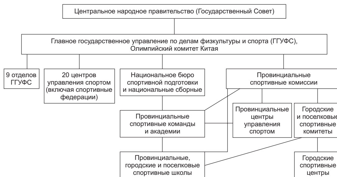
Рис. 2. Административная система китайского спорта после преобразования