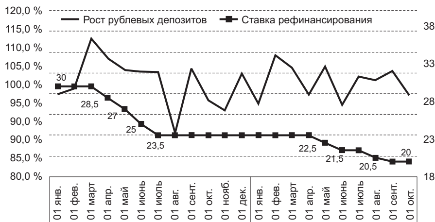
Рис. 2. Изменение рублевых депозитов по сравнению с предшествующим месяцем и динамика ставки рефинансирования, %