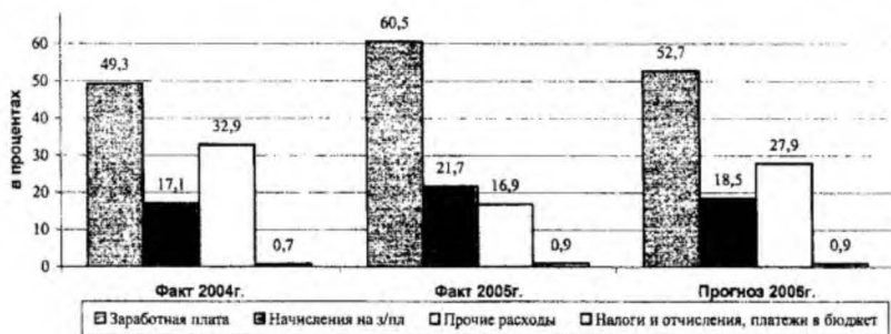
Рис. 2. Основные статьи расходов по Бобруйскому филиалу за 2004-2005 годы, прогноз на 2006 г.

По прогнозу на 2006 год намечается дальнейшее изменение в структуре доходов. Поступление средств от оплаты за обучение увеличится до 81,3 % к предшествующему году, а доля бюджетных поступлений планируется в размере 17,0 %. Следует также отметить, что снизятся поступления от прочих видов деятельности. Анализ расходов филиала за исследуемый период представлен на рис. 2.