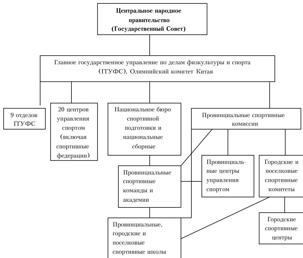
Рис. 2. Административная система китайского спорта после преобразования [3; 4]

Изменения в административной системе китайского спорта с 1997 г. проиллюстрированы на рис. 2. Что касается двадцати центров управления спортом, за исключением футбола, баскетбола и настольного тенниса, они далеки от хозрасчета. Центры по-прежнему в значительной степени зависят от выделяемых центральным правительством средств. С приближением Олимпийских игр в Пекине центральное правительство ничего не может предпринять кроме увеличения финансовой поддержки для «успеха» игр. Традиционная централизованная система остается и до сих пор играет важную роль в китайской спортивной системе [3].