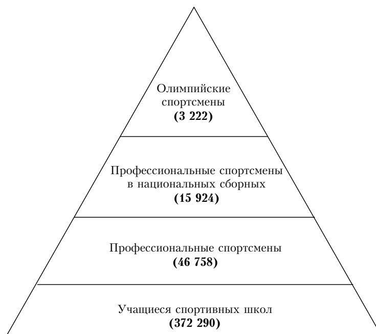
Рис. 3. Пирамида системы отбора спортсменов [4]

Китай имеет одну из самых эффективных в мире систем для отбора и тренировки спортивных талантов с самого раннего возраста. Как уже отмечалось, эта система была официально создана в 1963 г., когда Министерство спорта издало Положение о выдающихся спортсменах и командах. По поручению Министерства отбор талантливых молодых спортсменов проводился в каждой провинции [4]. За прошедшие годы система превратилась в хорошо организованную и жестко структурированную трехуровневую пирамиду, включающую первичный, промежуточный и высший уровни. Спортивные школы национального, регионального и городского уровней сформировали основание пирамиды (рис. 3). После нескольких лет обучения около 12 % талантливых спортсменов из спортивных школ отбирают в команды провинций, где они становятся профессиональными спортсменами. Самых выдающихся спортсменов включают в состав национальных и олимпийских команд. Данная система действует до сих пор.