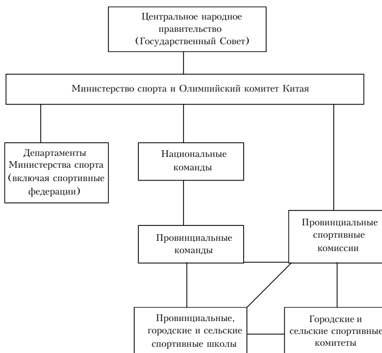
Рис. 1. Административная система китайского спорта [3; 4]

На рис. 1 показано, что Министерство спорта Китая работает непосредственно под руководством центрального правительства. Модель китайской спортивной административной системы повлияла на более широкий общественный строй в Китае. Как партия, так и государственная администрация, были организованы в обширной иерархии вертикальной власти. В 80-х гг. прошлого столетия китайская экономика прошла процесс трансформации от плановой к рыночной. В то же время, спортивная система была преобразована из централизованной в многоуровневую и многоканальную систему. В середине 90-х гг. XX в. Министерство спорта было преобразовано из Государственной комиссии физического воспитания и спорта в Главное государственное управление по делам физкультуры и спорта. Двадцать центров управления спортом были созданы для организации тренировок и финансирования. Изменение в названии и структуре было символическим и прагматичным. Министерство спорта стало более автономным и меньше полагается на государственную поддержку [3].