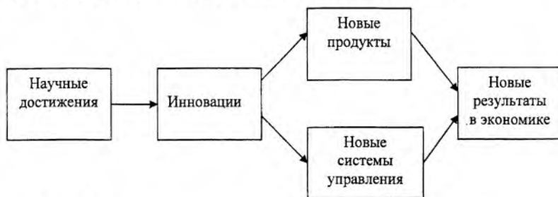
Рис. 2. Инновации в современной экономике: системный подход

фактор производства. Экономические результаты действия четвертого фактора производства (инноваций и предпринимательства) измеряются с помощью роста экономической прибыли, т. е. кривая средних общих издержек ( ATC_1 ) из состояния равновесия переходит в положение ATC_2 (рис. 1). При фиксировании достигнутого уровня инноваций происходит движение кривой средних общих издержек ( ATC_2 ) для достижения равновесия ( ATC_1 ), или даже к убытку. Кривая средних общих издержек будет при убытке проходить выше равновесного уровня цен ( P_0 ). Это происходит в силу закона убывающей отдачи.