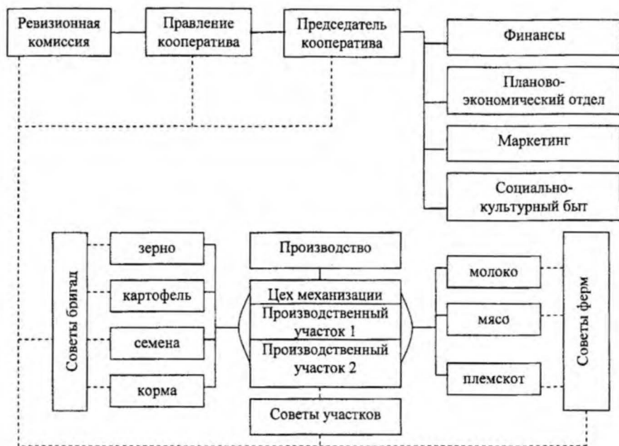
Рис. 2. Структура партисипативной организации (на примере РУСП «Совхоз «Киселевичи»)

Н.Г. Родцевич, канд. экон. наук, Т.Г. Авдеева Филиал БГЭУ (Бобруйск)