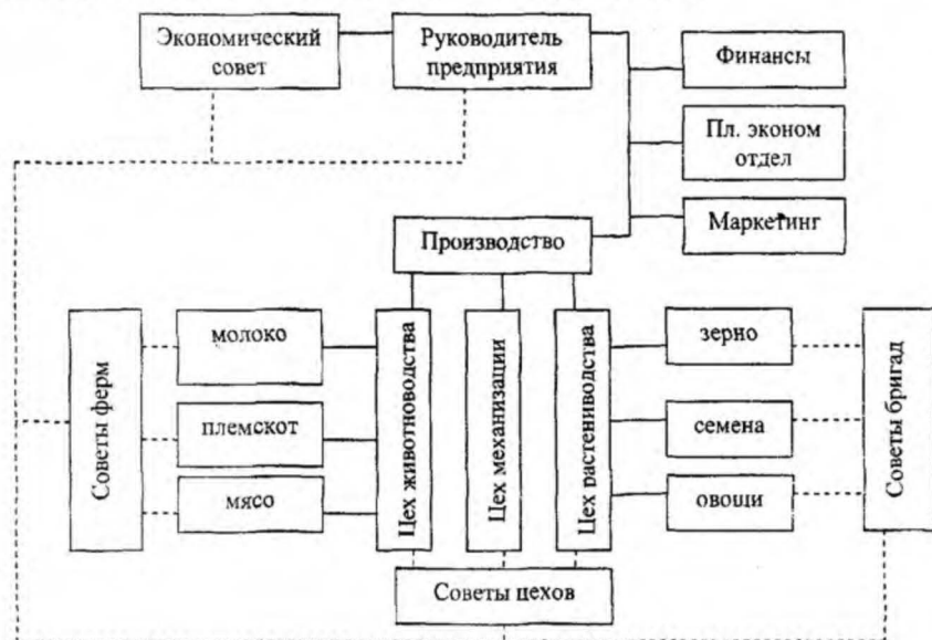
Рис. 1. Структура партисипативной организации (на примере колхоза «Гигант»)

Участие работников в управлении используется в различных организациях независимо от размеров, форм хозяйствования и отраслевой принадлежности. Так, использование партисипативного управления на предприятиях АПК имеет свои принципиальные особенности, так как организационная структура в сельскохозяйственных производственных кооперативах (СПК) уже содержит элементы партисипативной организации (правление кооператива, ревизионная комиссия и др.). В этой связи в АПК речь должна идти о совершенствовании системы, т.е. улучшении характеристик управления по определенному критерию – участию в управлении. В других субъектах хозяйствования (унитарные и акционерные предприятия, товарищества и общества, фермерские хозяйства) внедрение партисипативного управления должно рассматриваться с позиций развития, т.е. процесса перехода системы управления из одного качественного состояния в другое. На рисунках 1 и 2 представлены организационные структуры предприятий разных форм хозяйствования Бобруйского района и предлагаемые формирования партисипативного управления (пунктиром).