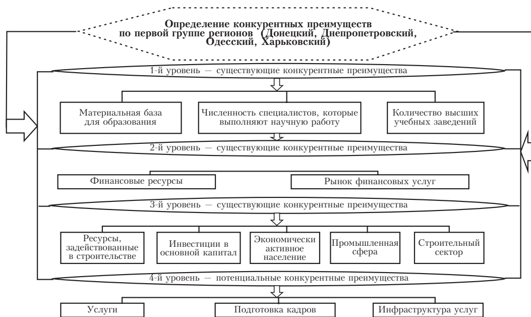
Рис. 2. Схема уровней взаимодействия конкурентных преимуществ в рамках первой группы регионов

Схема функционирования конкурентных преимуществ в рамках первой группы регионов приведена на рис. 2.