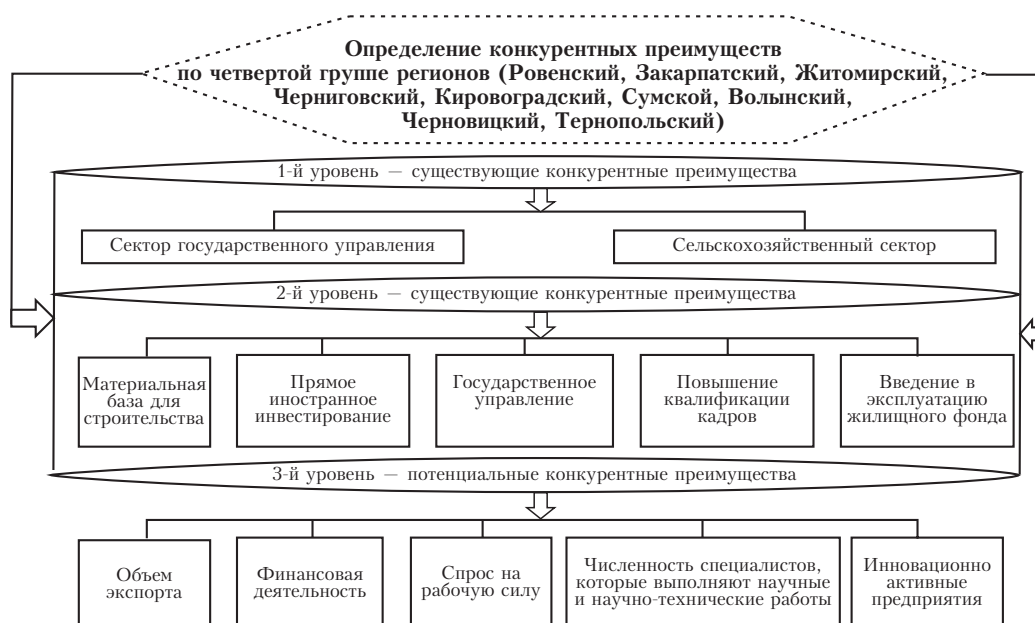
Рис. 5. Схема уровней взаимодействия конкурентных преимуществ в рамках четвертой группы регионов

кие, как объем экспорта; финансовая деятельность; спрос на рабочую силу; численность специалистов, которые выполняют научные и научно-технические работы; инновационно активные предприятия.