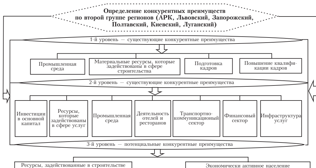
Рис. 3. Схема уровней взаимодействия конкурентных преимуществ в рамках второй группы регионов

Схема уровней взаимодействия конкурентных преимуществ в рамках второй группы регионов приведена на рис. 3.