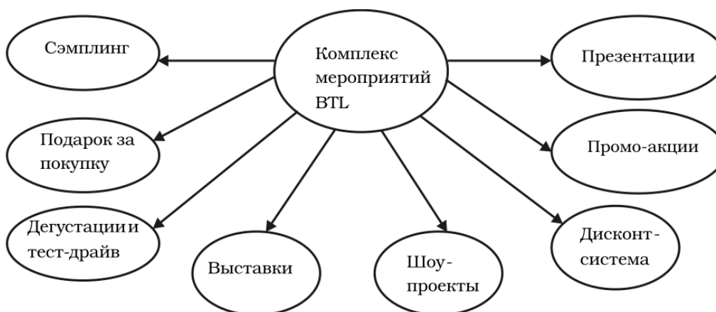
Рис. 2. Виды BTL-рекламы

– below-the-line (BTL) — мероприятия по продвижению товаров, которые не включают в себя размещение прямой рекламы. Одной из главных составляющих BTL являются все возможные формы стимулирования сбыта (рис. 2).