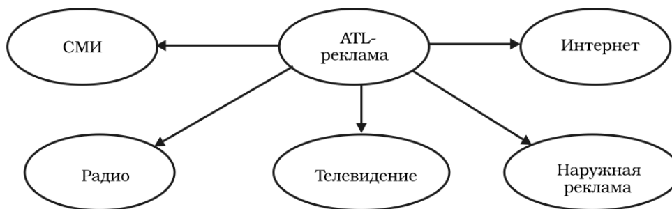
Рис. 1. Виды ATL-рекламы

– above-the-line (ATL) — мероприятия по размещению прямой рекламы, которые задействуют основные носители: прессу, телевидение, радио, наружную рекламу и Интернет. Затраты на ATL включают все расходы, связанные с размещением рекламы в средствах массовой информации. Выделяют пять составляющих (рис. 1);