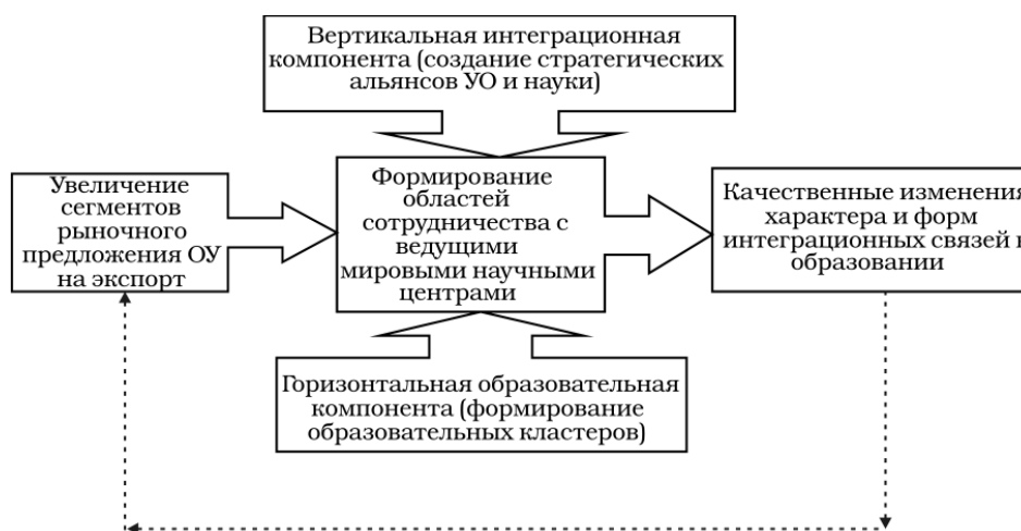
Рис. 2. Институциональный контур стратегии развития экспорта образовательных услуг Республики Беларусь

Институциональный контур , предлагаемый для совершенствования действующего механизма государственного регулирования рынка образовательных услуг Республики Беларусь, решает задачи регулирования вопросов экспорта и импорта образовательных услуг Республики Беларусь [7; 8]. Формирование данного контура создает институциональные области для взаимодействия различных субъектов национальной системы образования с мировым рынком образовательных услуг (рис. 2).