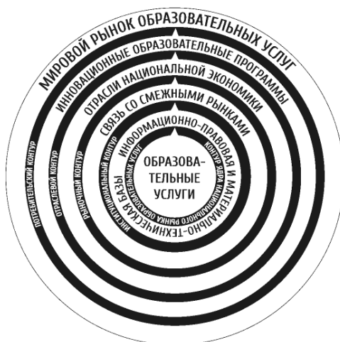
Рис. 1. Концентрическая модель экспортно-ориентированного рынка образовательных услуг

Особенность предлагаемого подхода к формированию концентрической модели рынка образовательных услуг состоит в том, что он учитывает синергетический эффект, возникающий при переходе национальной экономики на уровень инновационного развития (рис. 1).