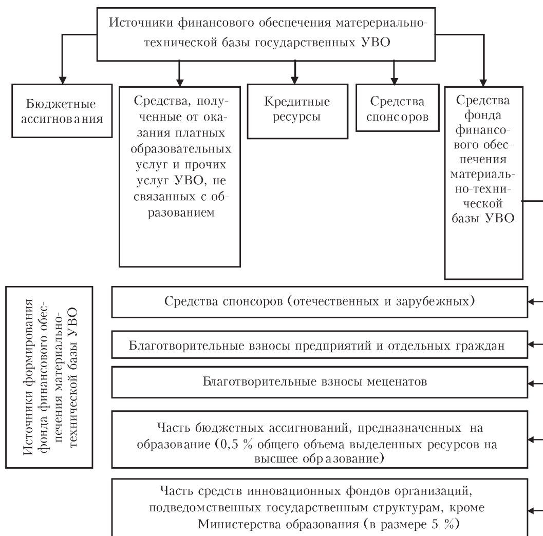
Рис. 2. Модель финансового обеспечения материально-технической базы государственных УВО

Нами также предлагается сформировать фонд финансового обеспечения материально-технической базы УВО. В качестве источников формирования данного фонда должны стать средства спонсоров (отечественных и зарубежных), благотворительные взносы предприятий и отдельных граждан, меценатов, а также в данный фонд целесообразно направлять часть бюджетных ассигнований, предназначенных на образование (примерно 0,3 – 0,5 % общего объема выделенных ресурсов на высшее образование — по аналогии с предложением Т.В. Сорокиной, Н.А. Кузнецовой, которые рекомендуют формировать резервный фонд Министерства образования [12, 166]), а также часть средств инновационных фондов организаций, подведомственных государственным структурам, кроме Министерства образования (в размере 5 %) [14].