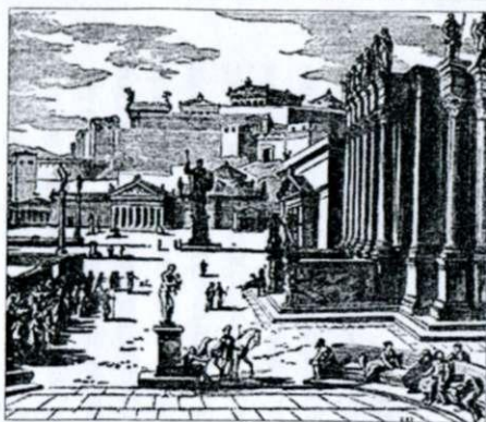
Так жили спартацы

С 18 до 30 лет всем юношам надо было пройти обучение как минимум в трех классах. Тотчас же после поступления в обучение мальчикам коротко стригли волосы. Постель их поначалу состояла из сена или соломы, без всякого одеяла, а по достижении ими 15 лет — из камыша, который они должны были без помощи ножа самостоятельно собирать по берегам реки. И летом, и зимой они ходили без обуви, в легкой простой одежде из шерсти, а в юношеском возрасте — без нижнего платья, в накидке из холстины. Чтобы приучить молодых людей стойко переносить голод, пищу им давали самую скудную, плохо приготовленную, а чтобы развить у них умение перехитрить неприятеля и выжить, в случае нужды им даже дозволялось красть что-то необходимое для жизни, но с одним условием — не попадаться. Человек, поймавший мальчика на воровстве в доме или в поле, обязан был наказать его или донести об этом педоному, который приказывал сопровождавшего его мастигофорам (рогносцам) высечь виновного. Главная же цель наказания заключалась в том, чтобы пристыдить мальчика в том, что он был недостаточно хитер и