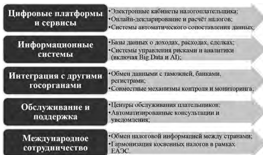
Рис. 2. Цифровая среда налогового администрирования

Среда включает совокупность составляющих, которые схематично можно представить на рис. 2.