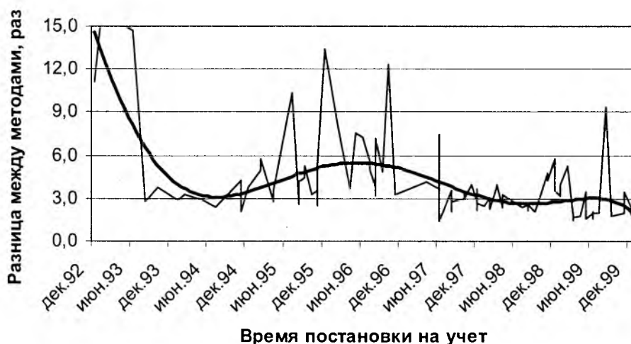
Рис. 1. Разница восстановительных стоимостей компьютеров при переоценке индексным методом и методом прямой оценки по времени постановки на учет. Ломаная линия – данные, кривая линия – тренд.