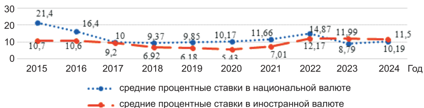
Рис. 1. Динамика средних процентных ставок по кредитам банков для организаций оптовой и розничной торговли в Республике Беларусь