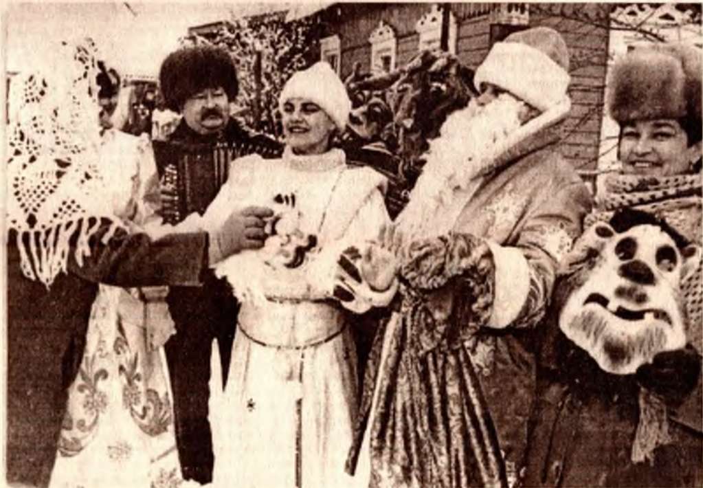
Рождество в деревне Старый Свержень Столбцовского района.

...Как знать, быть может, нам стоит поучиться веселиться и работать у наших предков. В самом деле, что может быть более надежным залогом успешного труда и полнокровной радости, чем связь поколений?