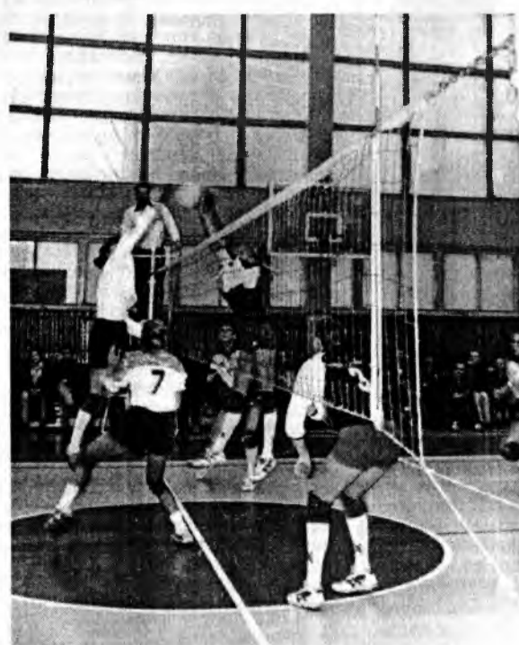
Финальный турнир со всей очевидностью показал возросший уровень студенческого женского волейбола и интерес к

Гродненчанки получили «серебро», но своего огорчения не скрывали. Бронзовые награды завоевала команда АФВис.