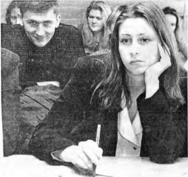
В Совете университета

Думаю, преподаватели нашего вуза прекрасно знают, какое это удовольствие вести занятия для девчонок: образцовая дисциплина на лекциях, высокая посещаемость, активность – все эти слова не даром женского рода: они полностью соответствуют духу группы УТ-2, где царит здоровое соперничество и желание быть не хуже, а лучше других.