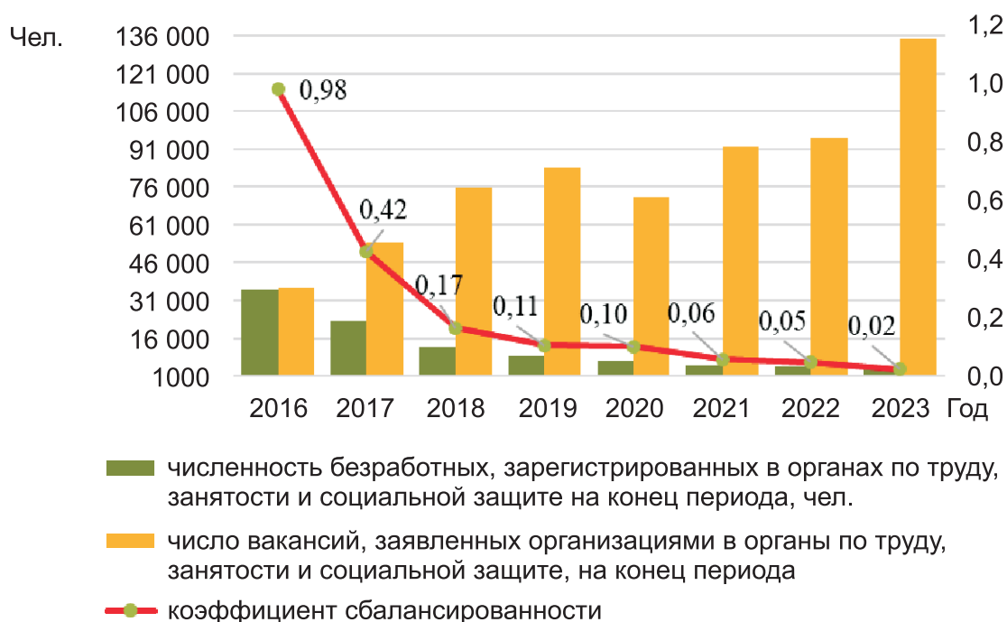
Рис. 1. Динамика коэффициента сбалансированности регистрируемого рынка труда в Республике Беларусь в 2016–2023 гг.

Однако, как видно на рис. 2, по методологии МОТ коэффициент сбалансированности рынка труда является трудоизбыточным и достигает своего пикового значения в 2016 г. — 8,38, минимального — в 2023 г. — 1,28 [2].