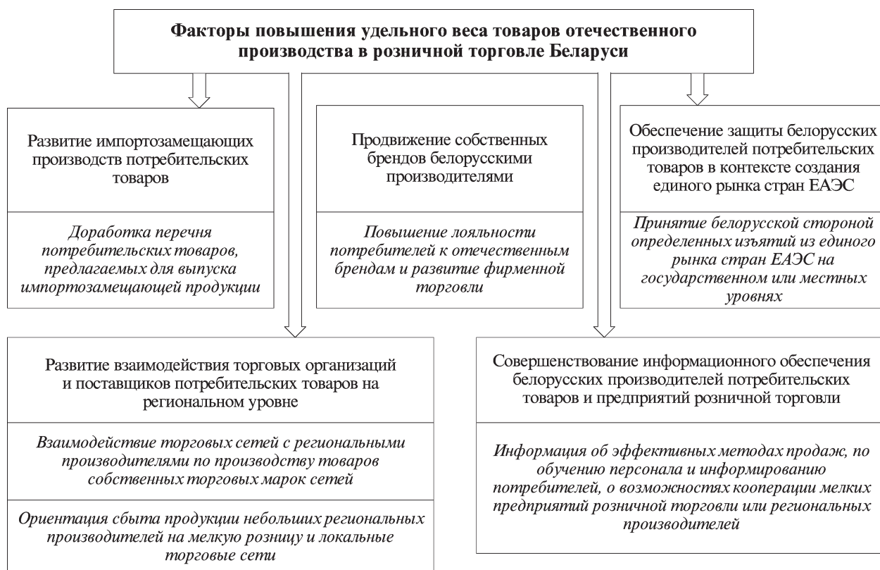
Рис. 2. Факторы повышения удельного веса товаров отечественного производства

Источник. URL: https://www.belstat.gov.by/ofitsialnaya-statistika/realny-sector-ekonomiki/vnytrennia-torgovlya/statisticheskie-izdaniya/index_77213/?ysclid=lv3icu4vln624380065 ; URL: https://www.belstat.gov.by/ofitsialnaya-statistika/publications/izdania/public_compilation/index_14058/?ysclid=lv3iq9jd3a509511231